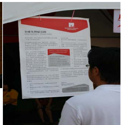
(右圖 全球失智症公約連署)