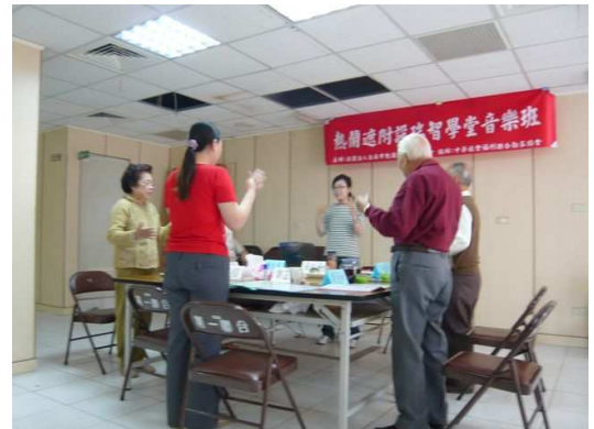
瑞智學堂音樂班成員進行歌曲帶動唱

家屬反應不勝枚舉，囿於版面有限，未能一一列述，明年起，瑞智學堂將陸續推出懷舊班及音樂班，歡迎有興趣的病友家屬，電洽本中心預約報名。